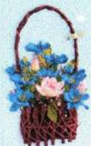
กระเช้าใหญ่ (20 x 28 ซม.) ราคา 450.- บาท