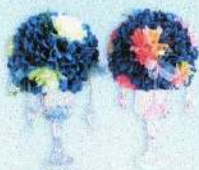
แจกันแก้ว (20 x 30 ซม.) ราคา 1,260.- บาท