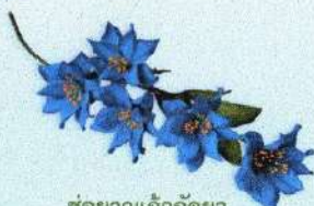
ช่อยาวแก้วกัลยา ราคา 120.- บาท