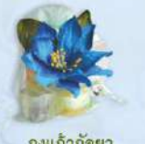
ถุงแก้วกัลยา (เพิ่มเส้น+ยาหม่อง.) ราคา 75.- บาท