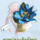
ยาหม่องแก้วกัลยา ราคา 45.- บาท