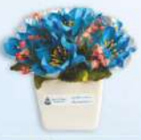
กระถางจิว (10 x 12 ซม.) ราคา 200.- บาท