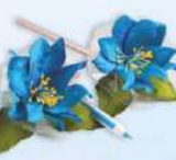
ปากกาแก้วกัลยา ราคา 30.- บาท