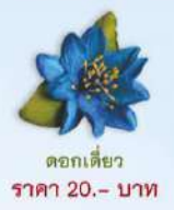
ดอกเดี๋ย ราคา 20.- บาท