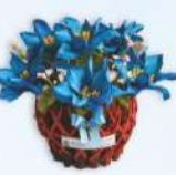
ตะกร้าเล็ก (10 x 12 ซม.) ราคา 200.- บาท