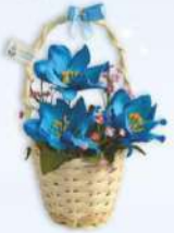
กระเช้าจิว (10 x 14 ซม.) ราคา 120.- บาท