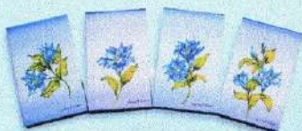
สมุดโน้ตแก้วกัลยา (9 x 15 ซม.) ราคา 55.- บาท