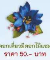
ดอกเดี๋ยมีดอกไม้แซม ราคา 50.- บาท